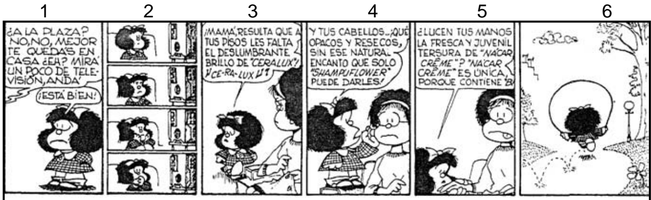
Quino: Todo Mafalda . Ed. Lumen